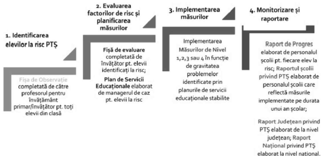
Figura 3. Etapele și instrumentele MATE Primar

Planul de acțiune MATE Primar se va completa cu elementele particulare de acțiune la nivelul de învățământ primar. Acesta reglementează procesul instituțional și operațional necesar pentru implementarea unui sistem eficace de avertizare timpurie și de colectare a datelor pentru prevenirea părăsirii timpurii a școlii. Planul de acțiune multianual pentru implementarea mecanismului propus include elemente-cheie, cum ar fi activitățile, responsabilitățile, calendarul, legăturile clare dintre acțiunile propuse și instrumentele care urmează să fie utilizate. Planul de acțiune grupează activitățile din cadrul componentelor de prevenire, intervenție și compensare în patru etape: identificare, evaluare și planificare, implementare și monitorizare. Activitățile sunt prezentate într-o secvență logică, menționându-se instrumentele utilizate în fiecare etapă și la fiecare nivel de intervenție.